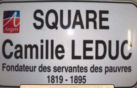
16 juillet: inauguration du square