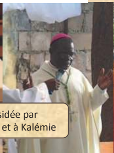
24 mars: messe présidée par Monseigneur à Angers... et à Kalémie