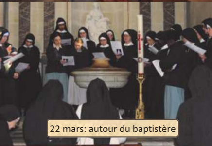
22 mars: autour du baptistère