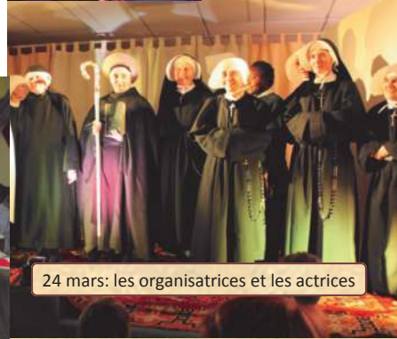
24 mars: les organisatrices et les actrices