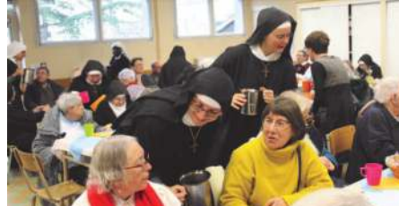
17 novembre : Journée mondiale des Pauvres