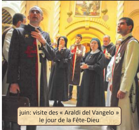
juin: visite des « Araldi del Vangelo » le jour de la Fête-Dieu