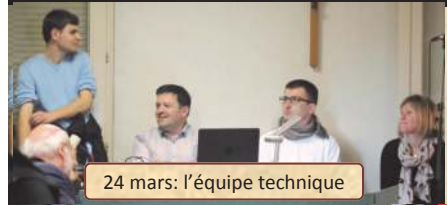
24 mars: l'équipe technique