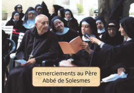
remerciements au Père Abbé de Solesmes