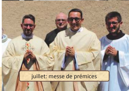
juillet: messe de prémices