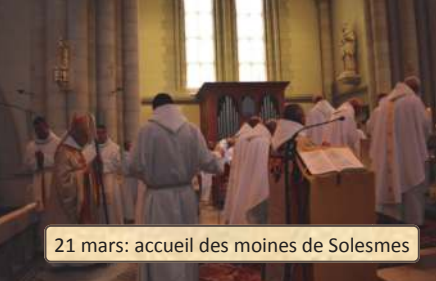
21 mars: accueil des moines de Solesmes