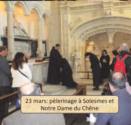
23 mars: pèlerinage à Solesmes et Notre Dame du Chêne