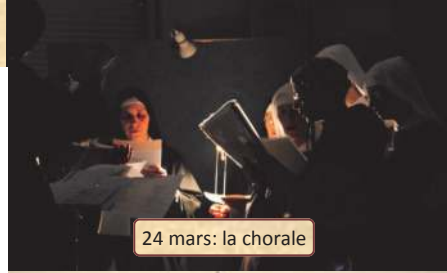
24 mars: la chorale

Au cours de ce mois de juillet à Angers, n'oublions pas de mentionner un évènement notable : l'inauguration, à deux pas de notre rue, d'une ancienne impasse rebaptisée « Square Dom Camille Leduc ». Tous les enfants du patronage étaient présents ainsi que des membres de leurs familles, de nos malades, amis, voisins.... Le soleil et la joie étaient au rendez-vous, ainsi que le maire d'Angers venu en personne pour la circonstance ! Après un bel échange de discours avec Mère Générale, le dévoilement de la plaque et le goûter ont réjoui les