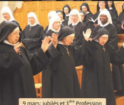
9 mars: jubilés et 1 ère Profession