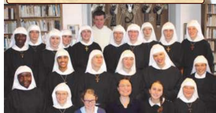
22 novembre: jeunes professes, novices et postulantes réunies pour une session de théologie