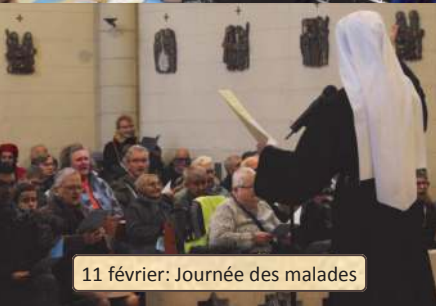
11 février: Journée des malades