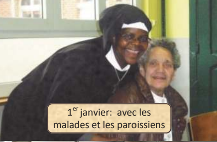
1 er janvier: avec les malades et les paroissiens