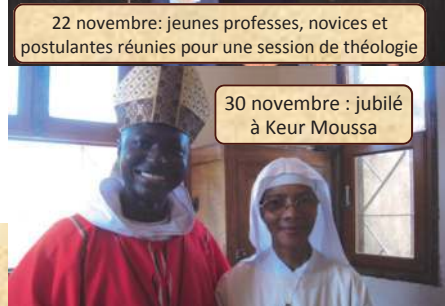
30 novembre : jubilé à Keur Moussa