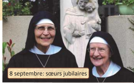
8 septembre: sœurs jubilaires

Cette belle mission nécessite d'être formées... et nous nous y employons de notre mieux en