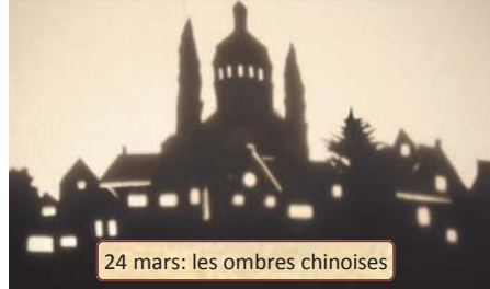
24 mars: les ombres chinoises