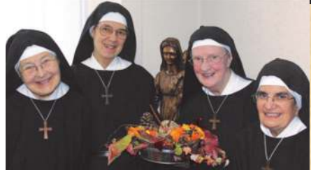
19 octobre: Jubilé de la « petite Ste-Cécile »