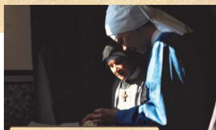
avril: préparation du cierge pascal

Les festivités du carême ne nous ont pas empêchées de porter les grandes intentions de prière, par l'offrande, notamment, de nos chemins de croix communautaires pour l'Église et le monde. La célébration des Jours Saints, juste après l'incendie de Notre-Dame de Paris a été empreinte d'un recueillement particulier. Le Temps Pascal nous a offert son jaillissement de vie et de joie ! L'approche du chapitre général de la Congrégation de Solesmes a mobilisé notre prière, et les fruits ne se sont pas faits attendre. Le 19 mai, en effet, notre Mère Générale nous a fait part d'une décision des