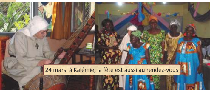
24 mars: à Kalémie, la fête est aussi au rendez-vous